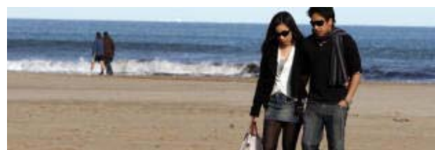
Una pareja pasea por la playa.

AGENCIAS. Establecer nuevas relaciones en Internet, a través de las páginas web de contactos, puede llegar a costar desde 180 hasta 400 euros al año a los cerca de siete millones de usuarios de este tipo de páginas, según explicó Mobifriends.com en un comunicado.